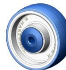
Roue Polyurethane + version ESD